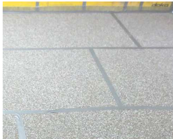
Abbildung A 2.1: Montagesituation mit Trittschalldämmmatten und Randdämmstreifen, Stöße mit Klebeband