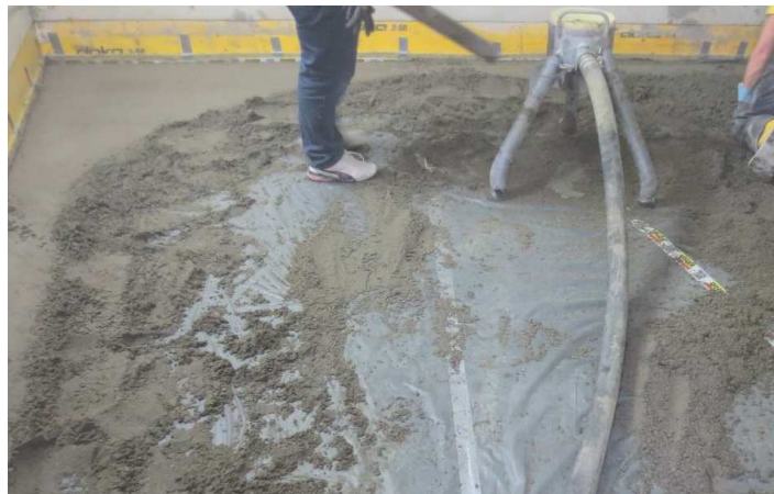
Abbildung A 2.2: Montagesituation mit Zementestrich