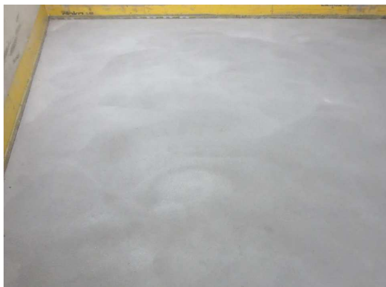
Abbildung A 2.3: Zementestrich (Prüfsituation)