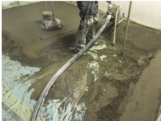
Abbildung A 2.2: Montagesituation mit Zementestrich