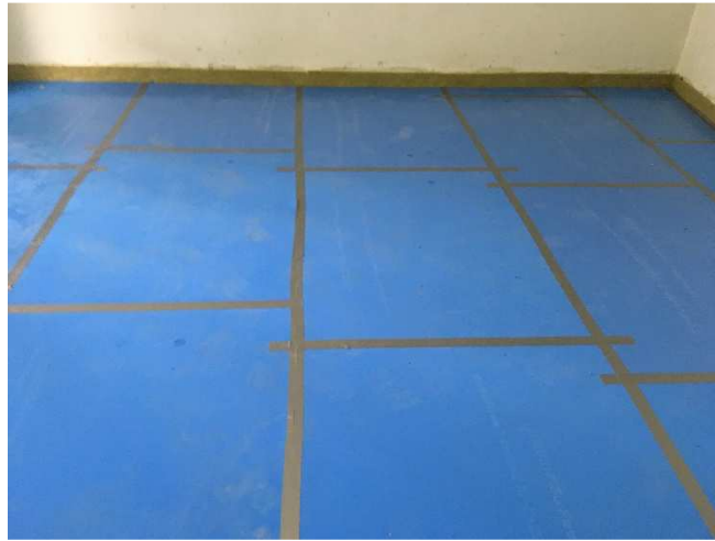
Abbildung A 2.1: Montagesituation mit Trittschalldämmmatten und Randdämmstreifen, Stöße mit Klebeband