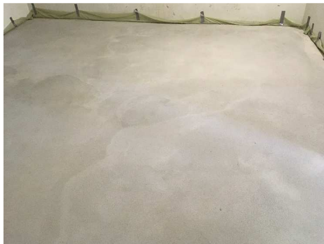
Abbildung A 2.3: Zementestrich (Prüfsituation)