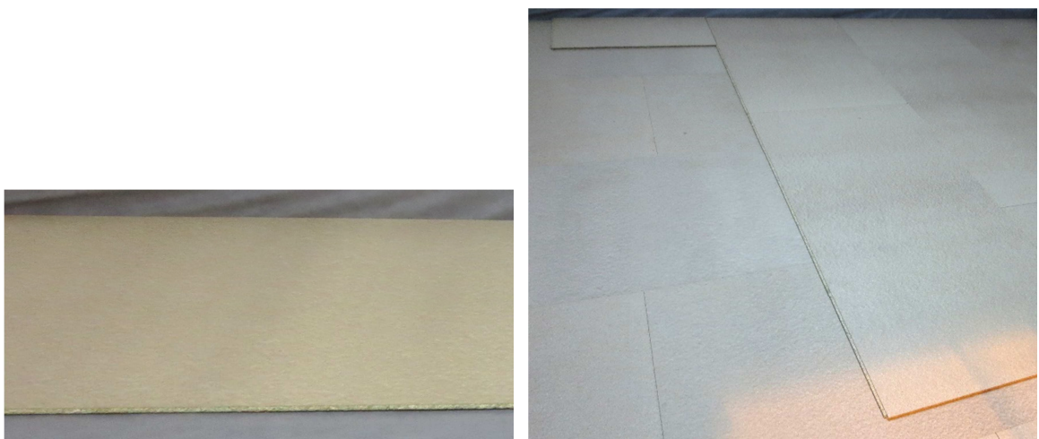
Abbildung A 2.3: Montagesituation Trockenestrich