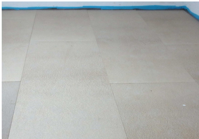
Abbildung A 2.4: Trockenestrich (Prüfsituation)