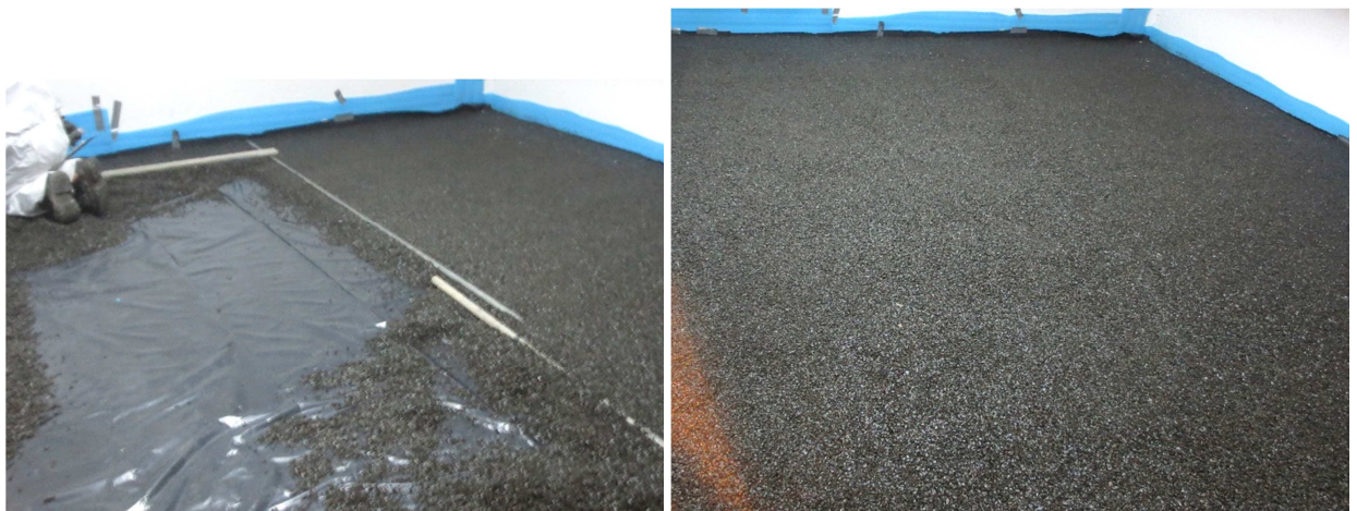
Abbildung A 2.1: Montagesituation – Einbau der Ausgleichs- und Schalldämmschüttung