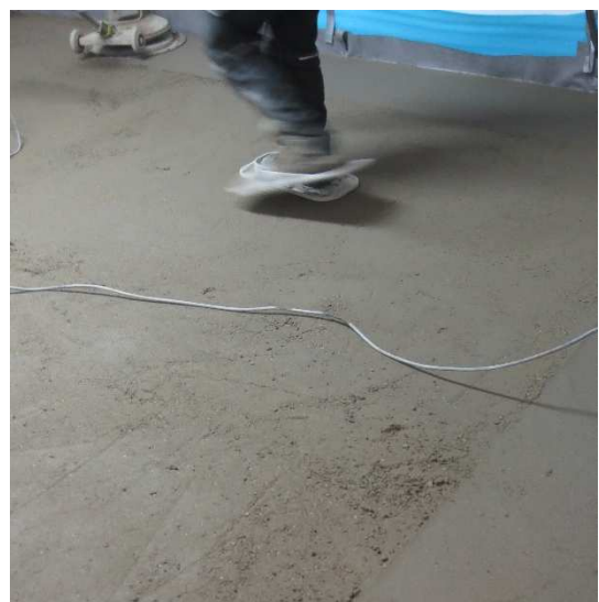
Abbildung A 2.3: Montagesituation Zementestrich