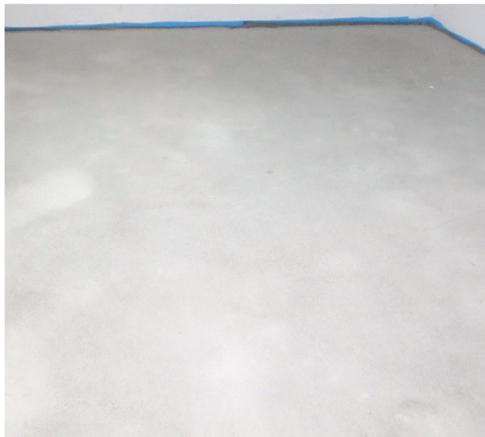
Abbildung A 2.4: Zementestrich (Prüfsituation)