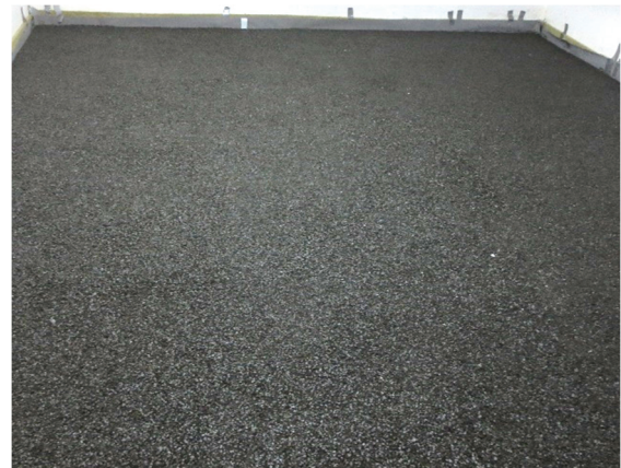
Abbildung A 2.2: Montagesituation – Einbau der Ausgleichs- und Schalldämmschüttung