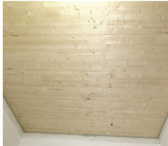
a) b) Abbildung A 2.1: Massivholz-Rohdecke a) oberseitig, vor dem Einbau des Fußbodenaufbaus, b) unterseitig