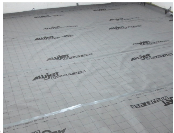
a) b) Abbildung A 2.3: Montagesituation a) Verlegung der Trittschalldämmmatten auf der erhärteten Ausgleichs- und Schalldämmschüttung, Stöße mit Klebeband, b) nach Auflegen der Alujet Difujet Bahn