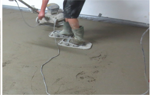
Abbildung A 2.4: Montagesituation Zementestrich