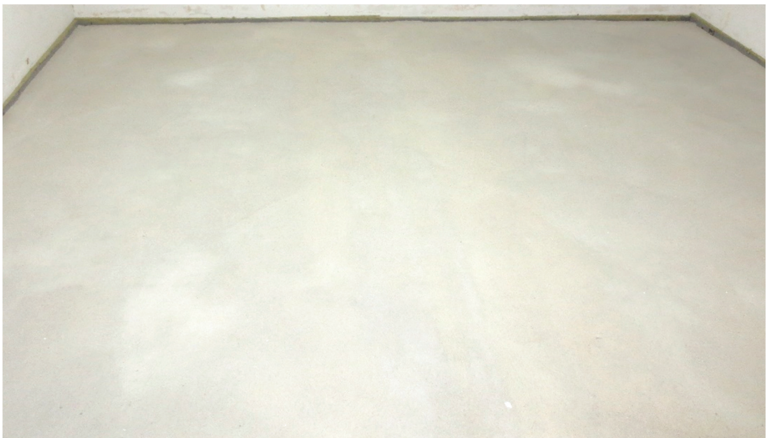
Abbildung A 2.5: Zementestrich (Prüfsituation)